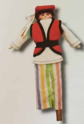
Fot. 33. Krakowiak

Para przedstawia typowe wyobrażenie o stroju krakowskim. Krakowianka ubrana jest w białą koszulę z kryzą, czarny, sznurowany gorsecik z naszytymi cekinami i koralikami, z krawędziami obwiedzionymi czerwonymi, ząbkowaną tasiemką pasmanteryjną. Na niej, ząbkowaną spódnicę z motywami kwiatowymi i różowymi ząbkami wzdłuż dolnej krawędzi i nalożoną niby-tulową zapaskę z naszytymi poprzecznie tasiemkami: białą, czerym i żółtą. Krakowiak ma na sobie czerwoną kamizelkę z czarnymi lamówkami, która zapewne ma udawać kaftan, i spodnie w kolorowe podłużne paski. Pod kaftanem przepasanym ciemną tasiemką ma ubraną na wypust koszulę bardziej przypominającą sweter. Na głowie założoną czerwoną rogatywkę z wstążeczkami.