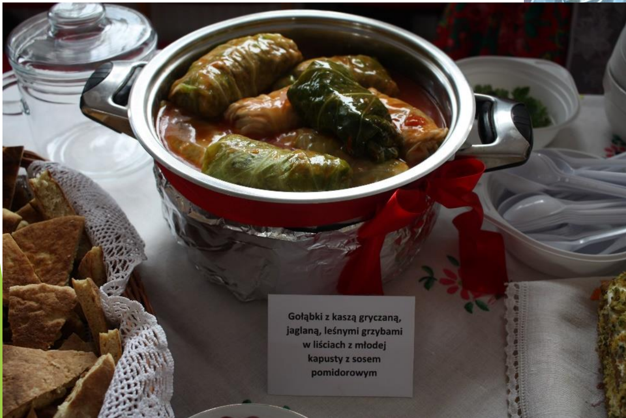
Gołąbki z kaszą gryczaną, jaglana, leśnymi grzybami w liściach z młodej kapusty z sosem pomidorowym