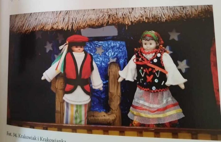
Fot. 34. Krakowiak i Krakowianka